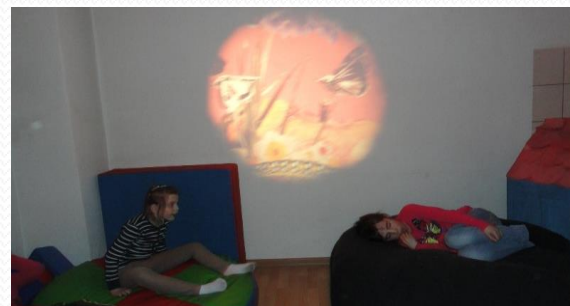
sala doświadczania świata