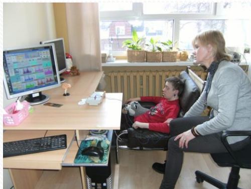
terapia EEG Biofeedback