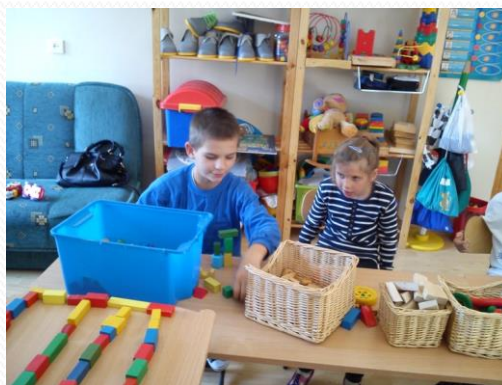
pracownia Marii Montessori